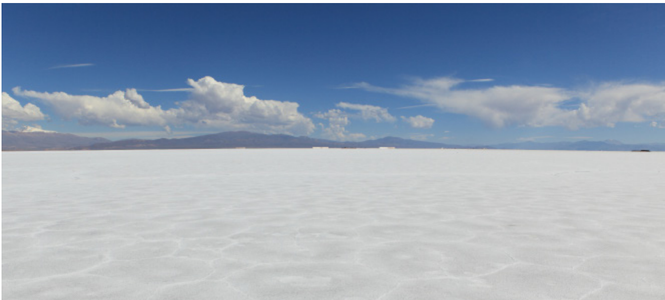
Der Salar de Atacama im Norden Chiles: Die unterirdische Sole des Salzsees weist den weltweit höchsten Gehalt an Lithiumsalzen auf. Schon jetzt heiß begehrt, dürften die Preise für Lithium durch Energiewende und fortschreitende Digitalisierung über Jahre, wenn nicht Jahrzehnte weiter kräftig anziehen.